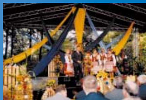
Dożynki w Jurczycach