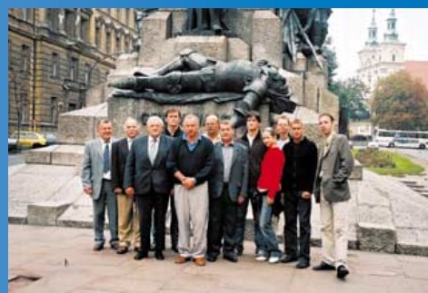
Współpraca z zagranicą