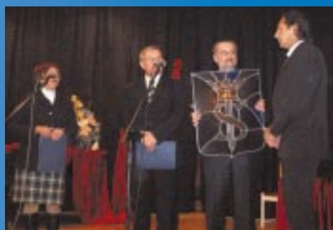
Wizyta delegacji z Civitanova Marche