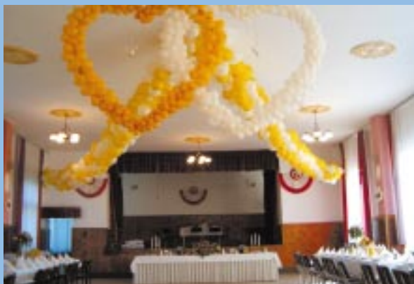
Duża sala w Domu Ludowym