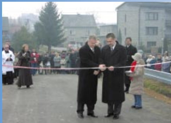
Oddanie do użytku mostu na Cedronie

Celem rekonstrukcji prehistorycznej wioski wg słów liderów Stowarzyszenia „Dziejba” jest odtwarzanie prehistorycznych konstrukcji mieszkalnych i użytkowych, prehistorycznych narzędzi oraz sposobów posługiwania się nimi, dawnych procesów technologicznych, ze szczególnym uwzględnieniem procesów wyrobu metali oraz pogłębianie i weryfikacja w praktyce wiedzy o odległej przeszłości. Działania te są związane również z ochroną środowiska i popularyzacją wiedzy. Docelowo w tym niespotykanym miejscu będą organizowane plenery i warsztaty artystyczne, wycieczki szkolne, rekreacja rodzinna oraz nauka jazdy konnej.