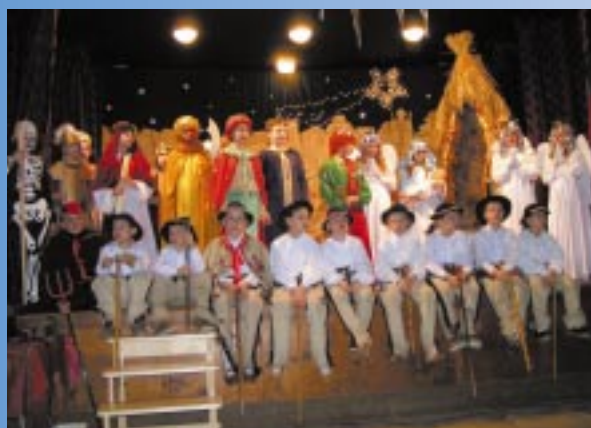
Jasełka w wykonaniu uczniów ZPO