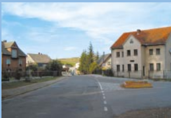
Centrum Woli Radziszowskiej