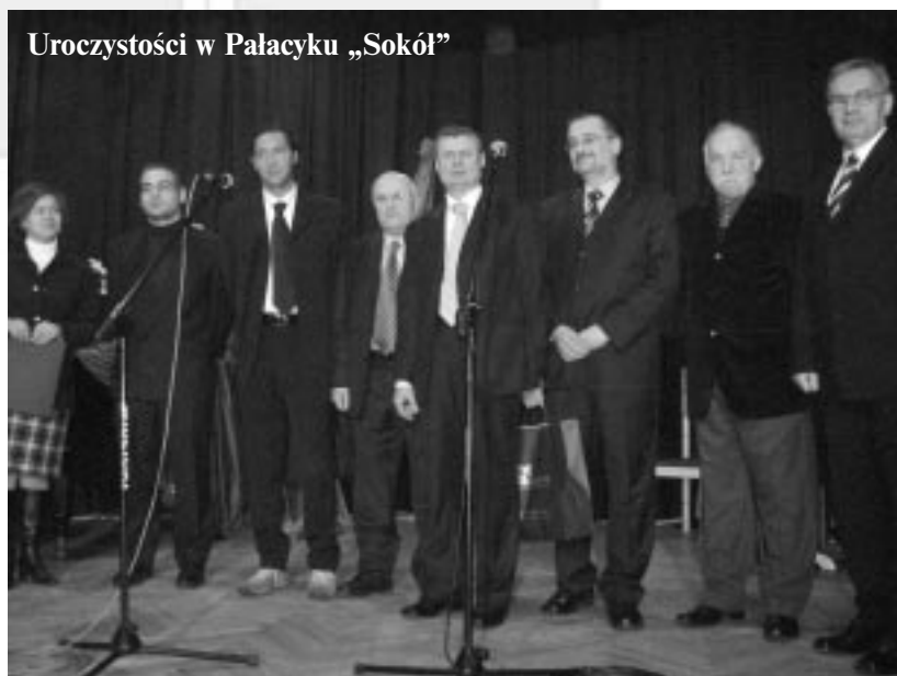
Uroczystości w Pałacyku „Sokół”

Aktualnie obie strony przygotowują się do sporządzenia odpowiedniego tekstu porozumienia, ponieważ już na miesiąc lipiec jest planowane oficjalne podpisanie umowy partnerskiej w Civitanova Marche, a w listopadzie w Skawinie.