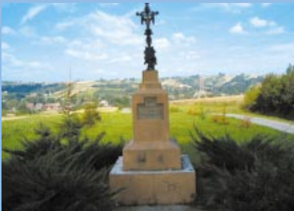
Kapliczka na cmentarzu cholernym