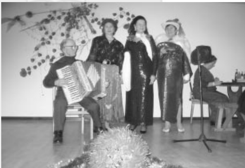
Noworoczne spotkanie w Samborku

Krakowskiej i ks. Popiełuszki, naprzeciw cmentarza parafialnego, pod zabudowę usługową o charakterze komercyjnym z wyłączeniem handlu oraz budownictwa mieszkaniowego.