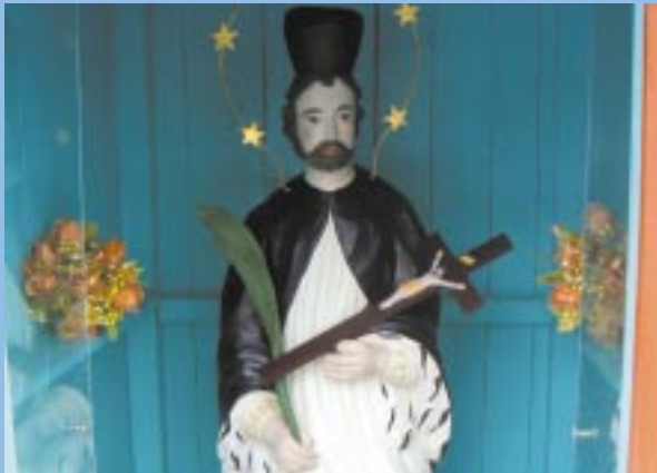
Figura św. Jana Nepomucena