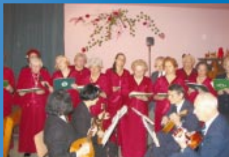
Co słychać w naszej Gminie