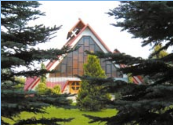
Nowy kościół parafialny