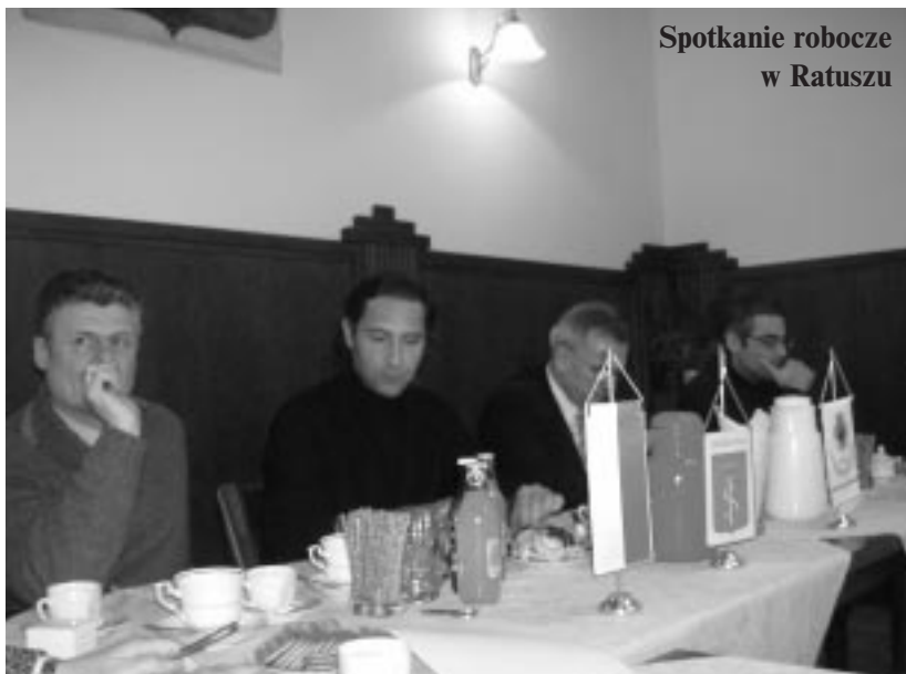
Spotkanie robocze w Ratuszu

Można powiedzieć, iż podpisanie umowy o partnerskiej współpracy z miastem Civitanova Marche we Włoszech jest coraz bliższe.