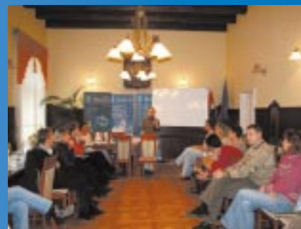
Profilaktyka uzależnień w Gminie Skawina