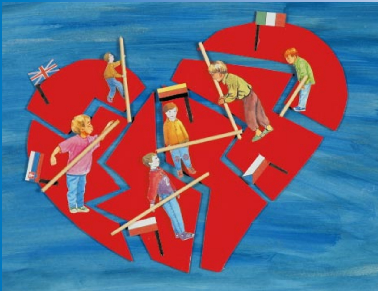
Piotr Lis – SP nr 4 Skawina