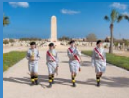
Skawińscy harcerze na szlaku