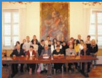
Współpraca z miastami partnerskimi