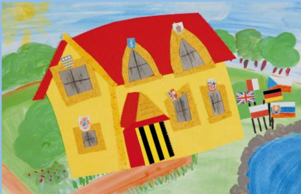
Natalia Szafraniec – SP nr 4 Skawina