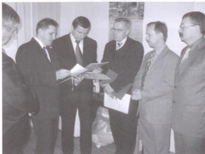
Wręczenie petycji Ministrowi Transportu i Budownictwa

Nie można tu nie wspomnieć o odbytych licznych spotkaniach i apelach mających na celu lobbing na rzecz modernizacji i przebudowy drogi krajowej oraz budowy obwodnicy Skawiny i uzyskania środków pomocowych z funduszy unijnych.