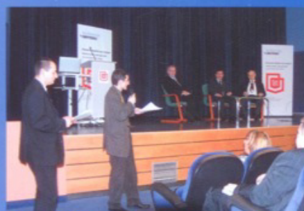
Debata w Warszawie str. 12