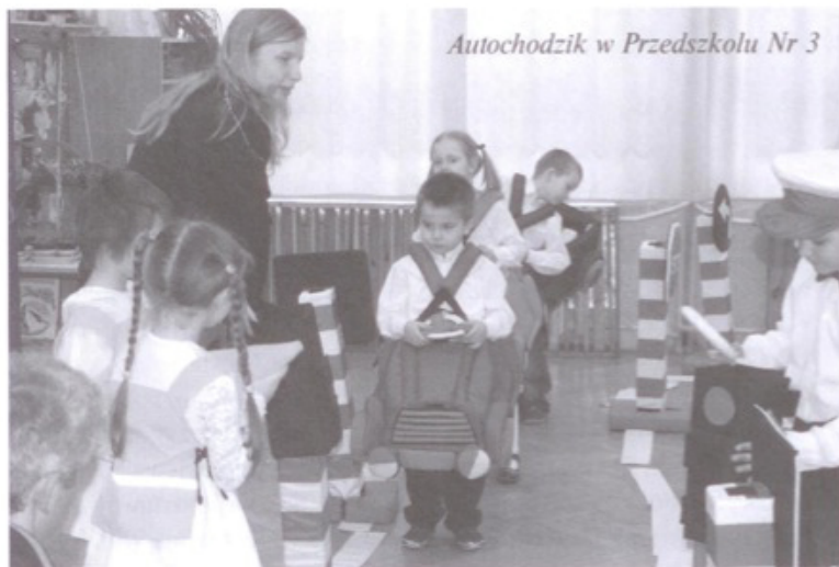
Autochodzik w Przedszkolu Nr 3

szolaczki będą mogły na co dzień, poprzez zabawę zdobywać wiedzę na temat przepisów ruchu drogowego. To zdecydowanie najlepszy i bezpieczny sposób wychowywania kolejnych pokoleń kierowców. Zarówno inicjator pomysłu, jak i sponsorzy otrzymali od przedszkolaczków przepiękne podziękowania.