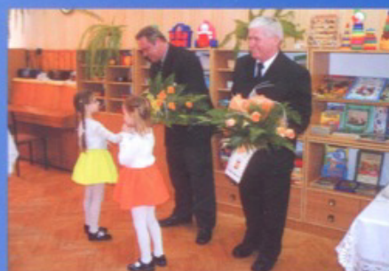
Co słychać w naszej Gminie str. 16-20