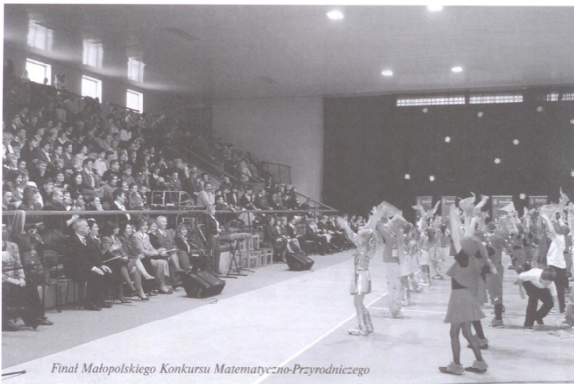
Finał Małopolskiego Konkursu Matematyczno-Przyrodniczego

dzianu wiedzy i umiejętności po szkole podstawowej.