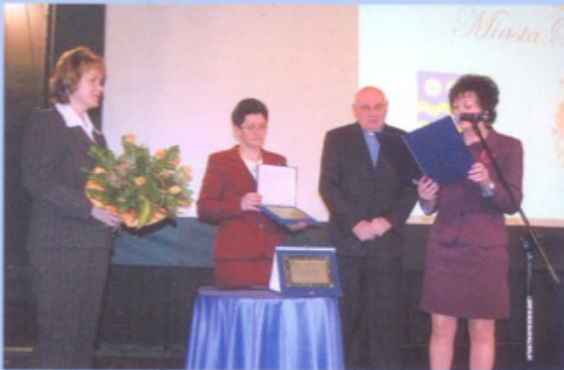
Wręczenie tytułu Honorowego Członka SSPM