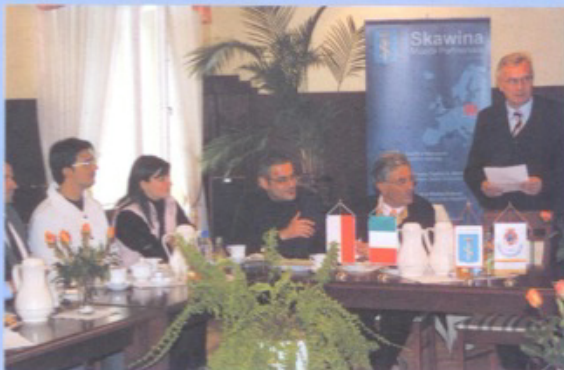
Spotkanie z przedsiębiorcami