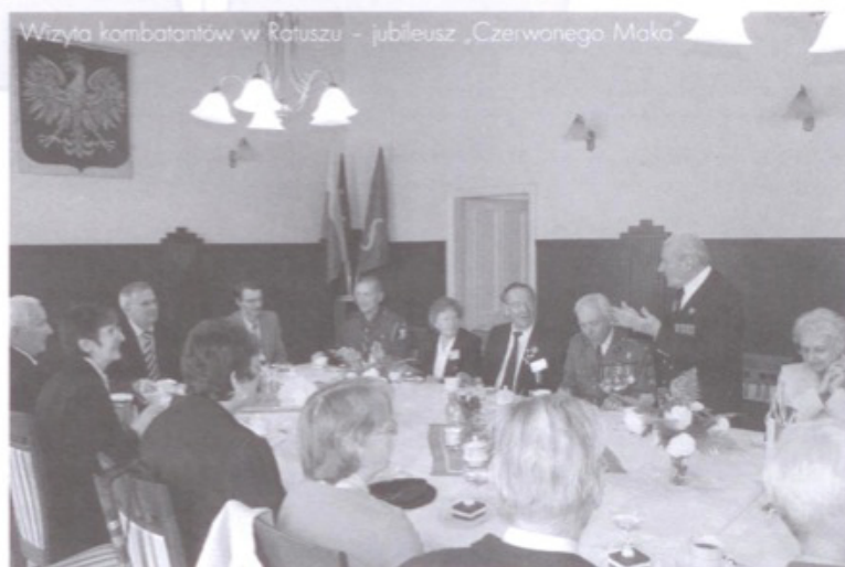
Wizyta kombatanów w Ratuszu - jubileusz „Czerwonego Maku”