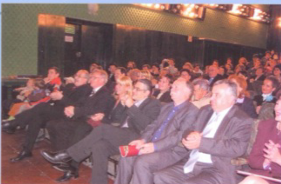
Spotkanie jubileuszowe w kinie „Piast”