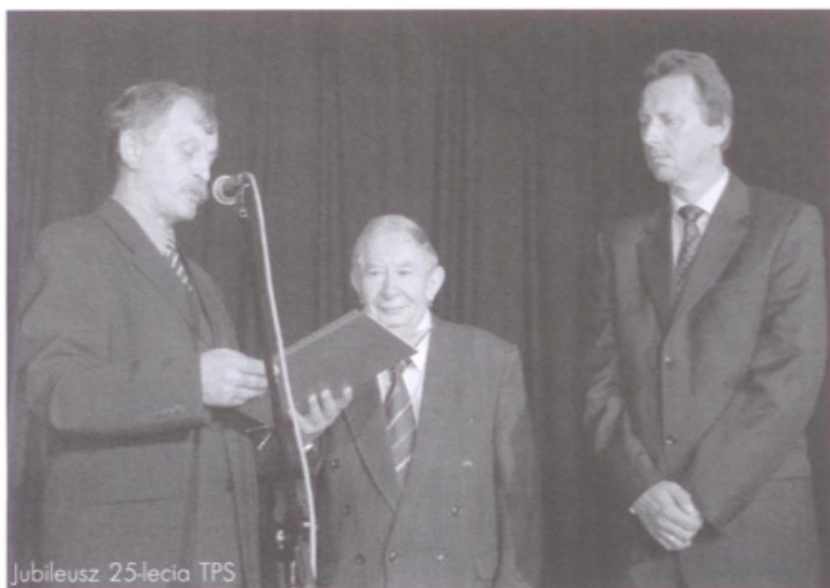
Jubileusz 25-lecia TPS

nożnej „Policjanci - Księża” zorganizowany przez Stowarzyszenie Pomocy Osobom Niepełnosprawnym i Ich Rodzinom „Kruszynki” oraz Wspólnotę Wiara i Światło „Kruszynki”. Od godzin popołudniowych w ramach tej imprezy dobroczynnej na stadionie oprócz meczu można było zobaczyć występ zespołów „Silesian Sound System” i „Grupa Przyjaciół”, wziąć udział w loterii fantowej i wspólnym grillowaniu. Były atrakcje dla dzieci i rozstrzygnięcie konkursu plastycznego „Niepełnosprawni w naszych oczach”.