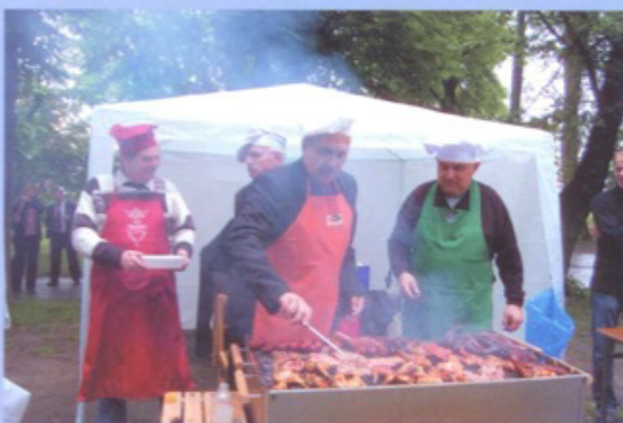
Akcja charytatywna – wspólne grillowanie