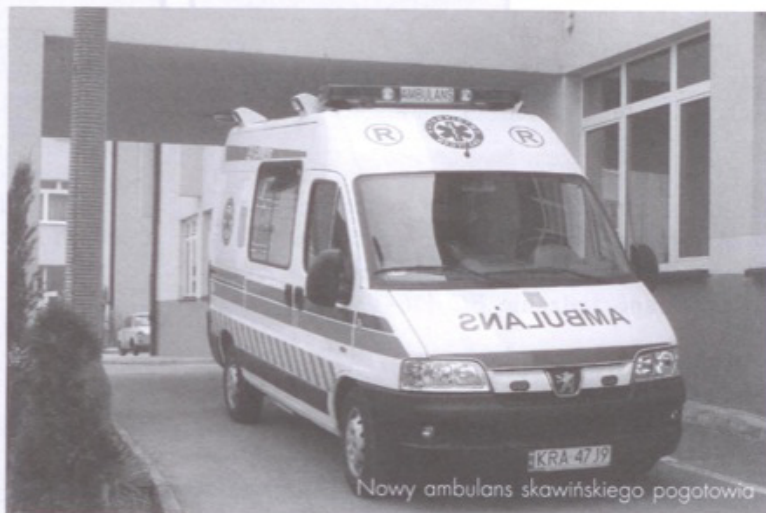
Nowy ambulans skawińskiego pogotowia

Program imprezy obejmował zawody w udzielaniu pierwszej pomocy dla szkół gimnazjalnych i ponadgimnazjalnych, test kompetencyjny,