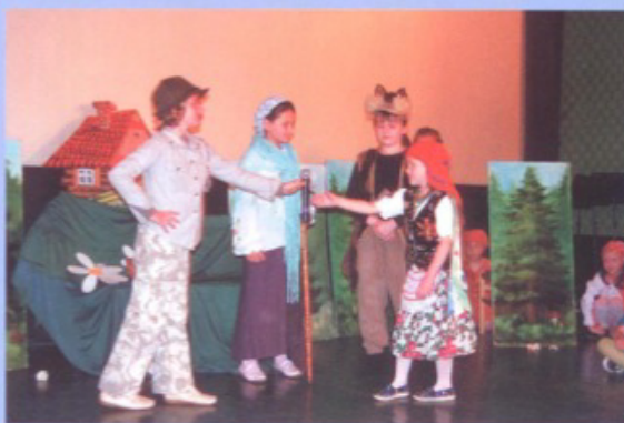
Występy dzieci ze skawińskich szkół