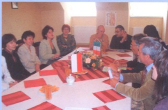
Spotkanie z nauczycielami