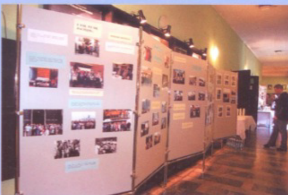
Wystawa – historia współpracy partnerskiej