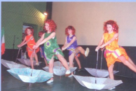
Występy dzieci z Turciańskich Teplic