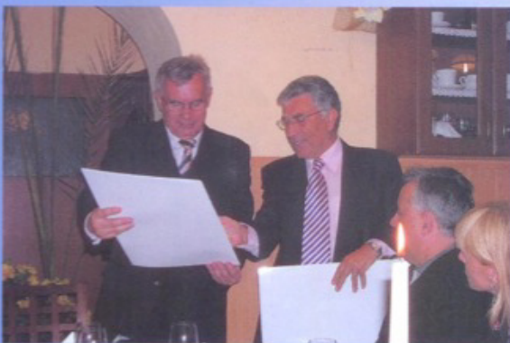
Spotkanie z delegacjami