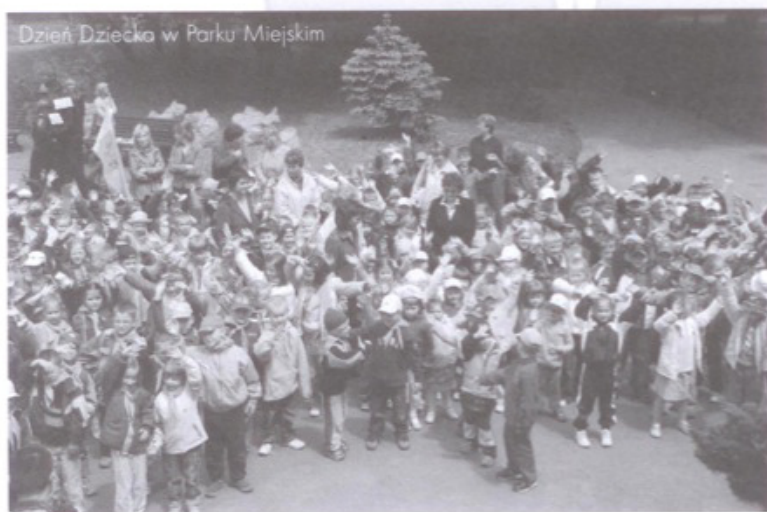
Dzień Dziecka w Parku Miejskim

W niedzielę 18 czerwca na stadionie „Skawinki” tradycyjnie już odbył się mecz piłki