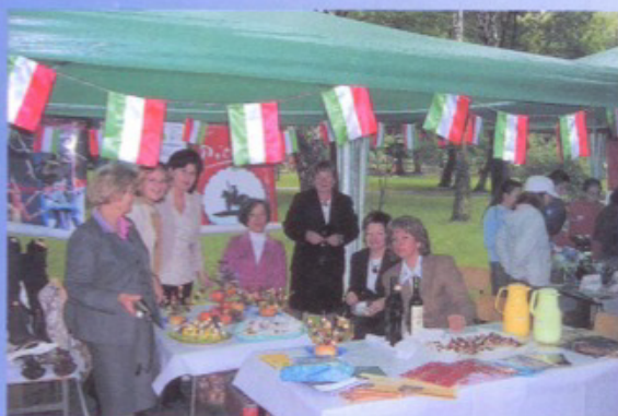
Stoisko Civitanova Marche

Mamy nadzieję, iż dzięki takim inicjatywom, jak promocja zagranicznych partnerów na naszym terenie, Skawińskie Stowarzyszenie Partnerstwa Miast zyska nowych członków lub zwolenników, a mieszkańcy Gminy Skawina zechcą osobiście wybrać się do któregoś z tych miast.