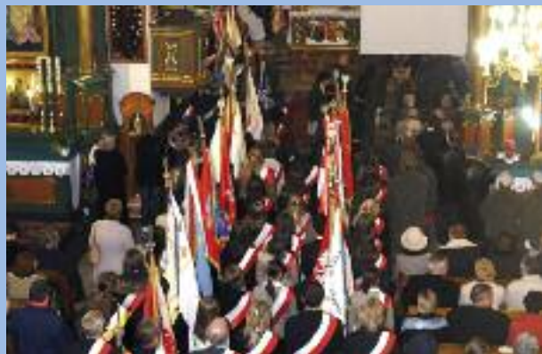
Liczenie zgromadzone poczty sztandarowe