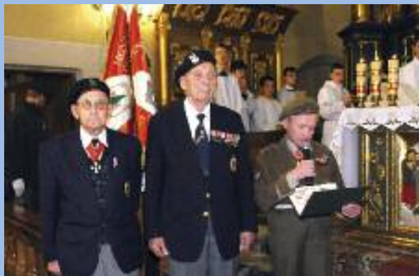
Kombatanci Polskiego 2. Korpusu