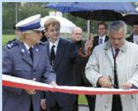
Otwarcie Miasteczka Komunikacyjnego