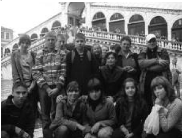
Zespół Katolickich Szkół im. Jana Pawła II

Rok szkolny 2008/2009 w Katolickim Gimnazjum i Liceum im. Jana Pawła II upływa pod hasłem „Święty Paweł – człowiek, który w życiu poczuł rękę Boga”. Taki tytuł nosi projekt, który realizuje szkoła, włączając się tym samym w obchody roku św. Pawła.