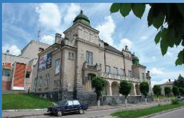
Młodzieżowy Dom Kultury „Sokół”