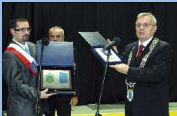
Przekazanie pamiątkowych upominków