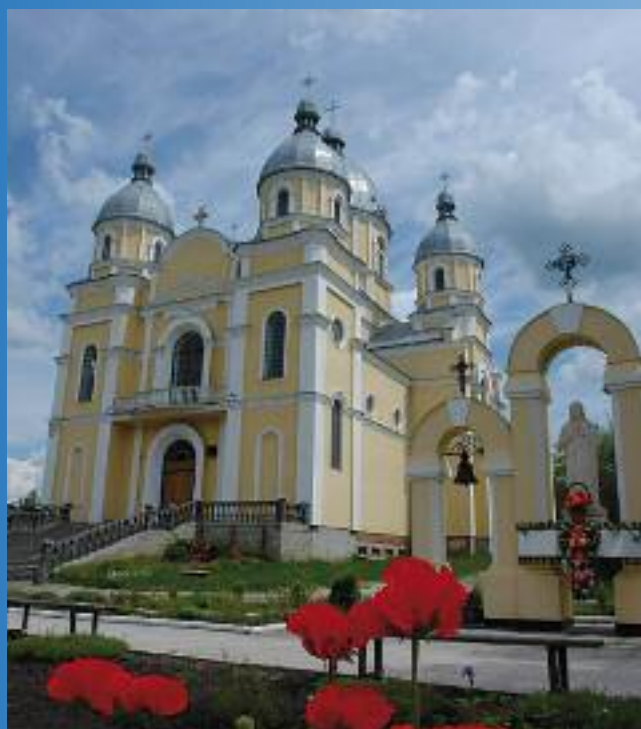
Cerkiew Św. Włodzimierza

11 listopada w trakcie uroczystej sesji Rady Miejskiej podczas obchodów Święta Niepodległości, podpisana została umowa partnerska z miastem Przemyślany na Ukrainie. Poniżej znajdują Państwo kilka podstawowych informacji o mieście.