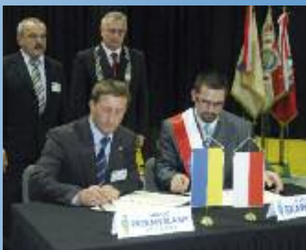
II listopada 2008 r.