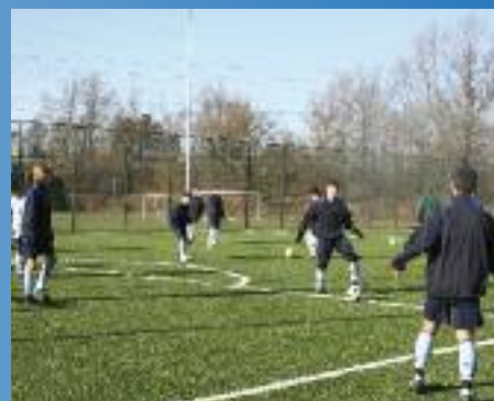
Orlik w Skawinie