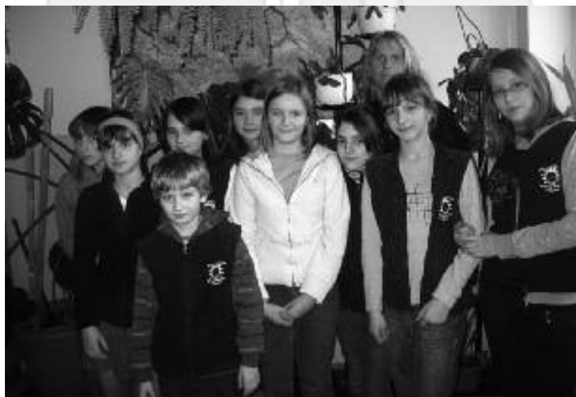
Reprezentacja Szkoły Podstawowej nr 1 w Skawinie

Projekt finansowany z funduszu dla organizacji pozarządowych FOP, komponent ochrony środowiska i zrównoważony rozwój.