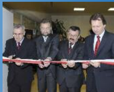
Otwarcie sali gimnastycznej w Szkole Podstawowej nr 4