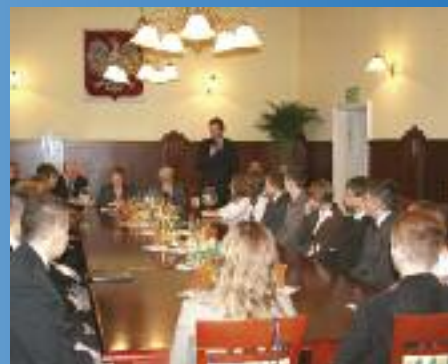
I Sesja Młodzieżowej Rady Miejskiej str. 9