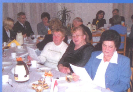
Serwis informacyjny SSPM