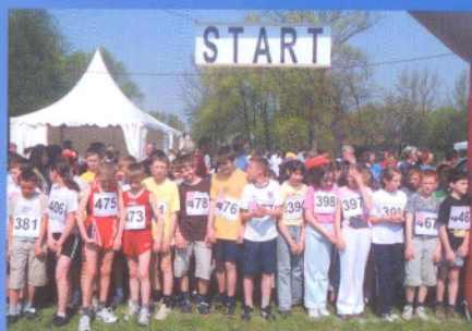
Profilaktyka uzależnień w gminie Skawina