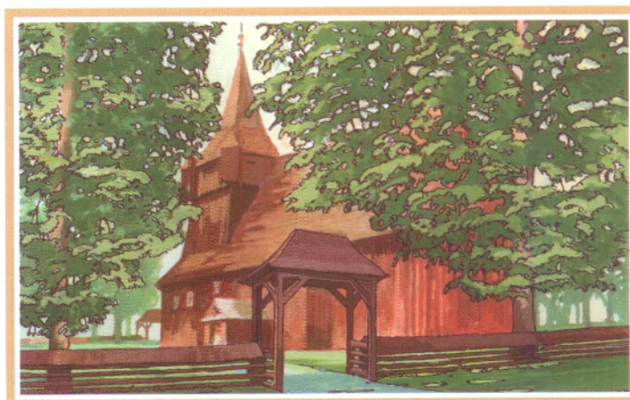
Kościół pw. Wniebowstąpienia N.M.P.