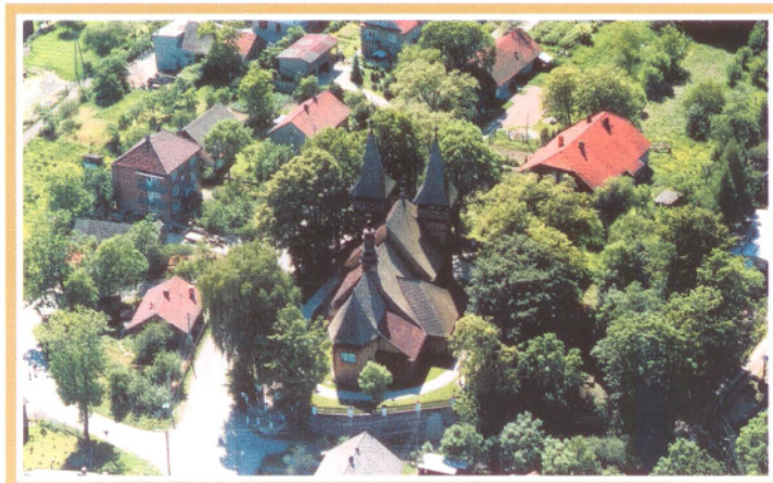
Widok z powietrza - Krzęcin, Muzeum Pomorza