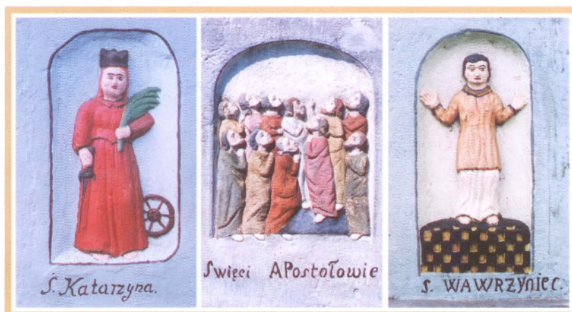
Przygody na młotku