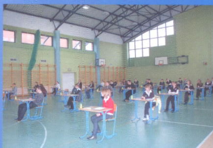
Z życia gminnych szkół