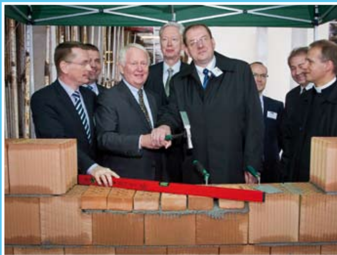
Fot. Bahlsen Polska

Misja firmy „Osładzamy życie” trafnie obrazuje tradycję i doświadczenie przedsiębiorstwa, które od ponad 120 lat dostarcza klientom słodkiej przyjemności.